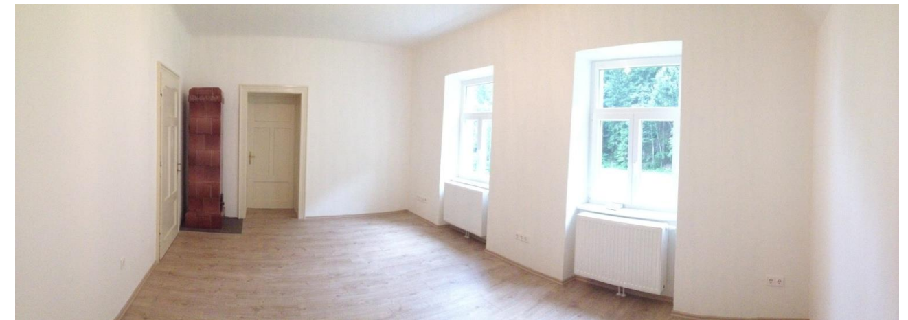
Wohnzimmer mit Kachelofen