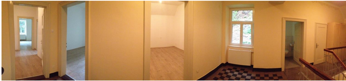
1. Stock - Eingangsbereich

Laas Nr. 38, bestehend aus EG und 1. Stock